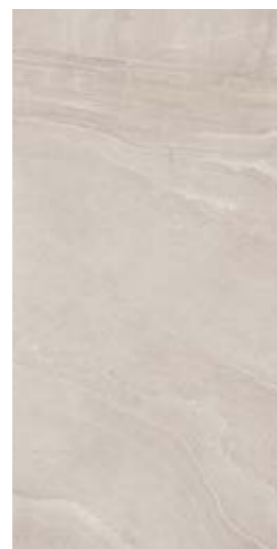
60x120 - 23 5/8 "x47 1/4 " 985Z8R Asian Grey Nat. Rett. 87 985Z8P Asian Grey Lapp. Rett. 91