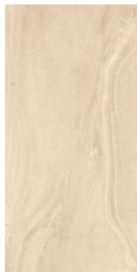
60x120 - 23 5/8 "x47 1/4 " 985Z3R Indian Beige Nat. Rett. 87 985Z3P Indian Beige Lapp. Rett. 91