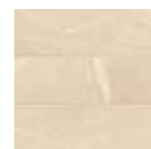
30x30 - 11 13/16 "x11 13/16 " K305Z3R Indian Beige Nat. Rett. 120