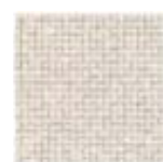
30x30 - 11 13/16 "x11 13/16 " Z305Z0R Bolivian White Nat. 156