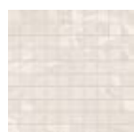
30x30 - 11 13/16 "x11 13/16 " I305Z0R Bolivian White Nat. Rett. 138 I305Z0P Bolivian White Lapp. Rett. 143