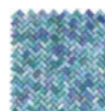
31,6x31,6 - 12 7/16 "x12 7/16 " T30004 Lustrato Verde/Azzurro Pcs. Box 5 86

*Su rete in fibra On fibre mesh backing Sur filet en fibre de verre Auf Glasfasernetz Sobre malla de fibra На волоконной сетке