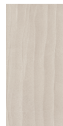
45x90 - 17 11/16 "x35 7/16 " 946Z8R Gobi Grey Nat. Rett. 82 946Z8P Gobi Grey Lapp. Rett. 90