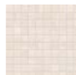
30x30 - 11 13/16 "x11 13/16 " I306Z0R Salar White Nat. Rett. 138