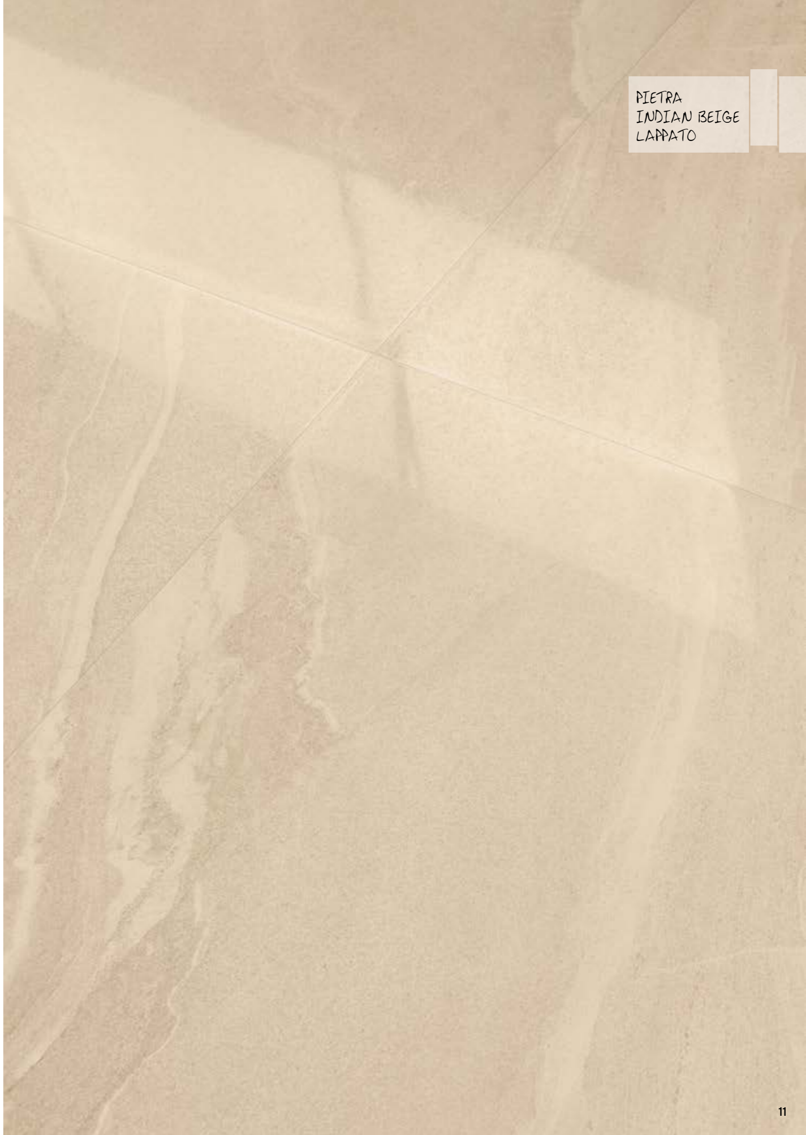
985Z3P 60x120 - 23 5 / 8 "x47 1 / 4 " Indian Beige Lapp. Rett.