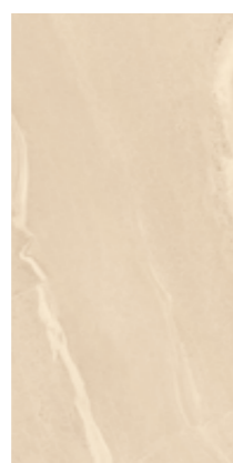
45x90 - 17 11/16 "x35 7/16 " 945Z3R Indian Beige Nat. Rett. 79 945Z3P Indian Beige Lapp. Rett. 87