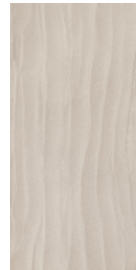
60x120 - 23 5/8 "x47 1/4 " 986Z8R Gobi Grey Nat. Rett. 89 986Z8P Gobi Grey Lapp. Rett. 94