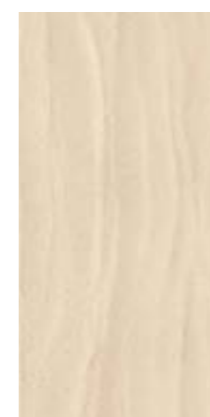
45x90 - 17 11/16 "x35 7/16 " 946Z3R Thar Beige Nat. Rett. 82 946Z3P Thar Beige Lapp. Rett. 90