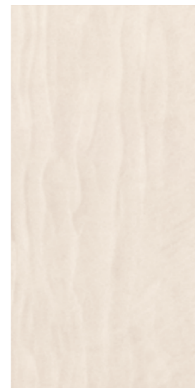
60x120 - 23 5/8 "x47 1/4 " 986Z0R Salar White Nat. Rett. 89 986Z0P Salar White Lapp. Rett. 94