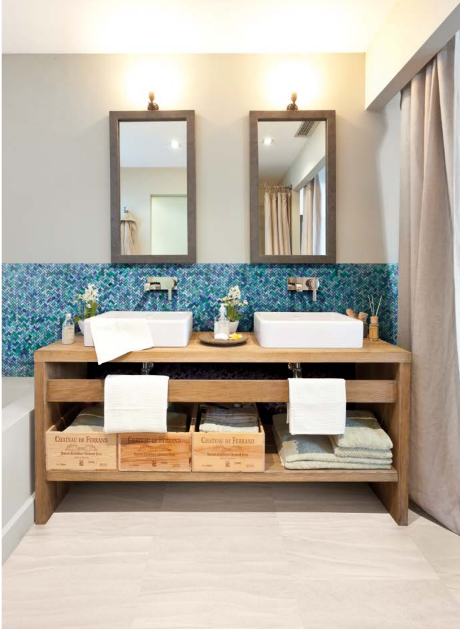
636Z0R 30x60 - 11 13/16 "x23 5/8 " Salar White Nat. Rett.