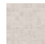
30x30 - 11 13/16 "x11 13/16 " I305Z8R Asian Grey Nat. Rett. 138 I305Z8P Asian Grey Lapp. Rett. 143