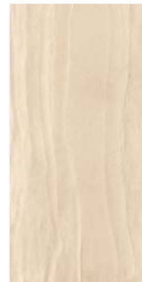
60x120 - 23 5/8 "x47 1/4 " 986Z3R Thar Beige Nat. Rett. 89 986Z3P Thar Beige Lapp. Rett. 94