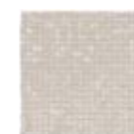
30x30 - 11 13/16 "x11 13/16 " Z305Z8R Asian Grey Nat. 156

* Su rete in fibra On fibre mesh backing Sur filet en fibre de verre Auf Glasfasernetz Sobre malla de fibra На волоконной сетке