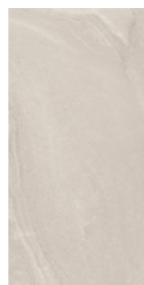
45x90 - 17 11/16 "x35 7/16 " 945Z8R Asian Grey Nat. Rett. 79 945Z8P Asian Grey Lapp. Rett. 87