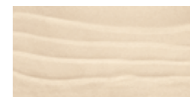
30x60 - 11 13/16 "x23 5/8 " 636Z3R Thar Beige Nat. Rett. 60