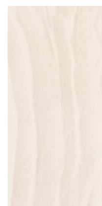
45x90 - 17 11/16 "x35 7/16 " 946Z0R Salar White Nat. Rett. 82 946Z0P Salar White Lapp. Rett. 90