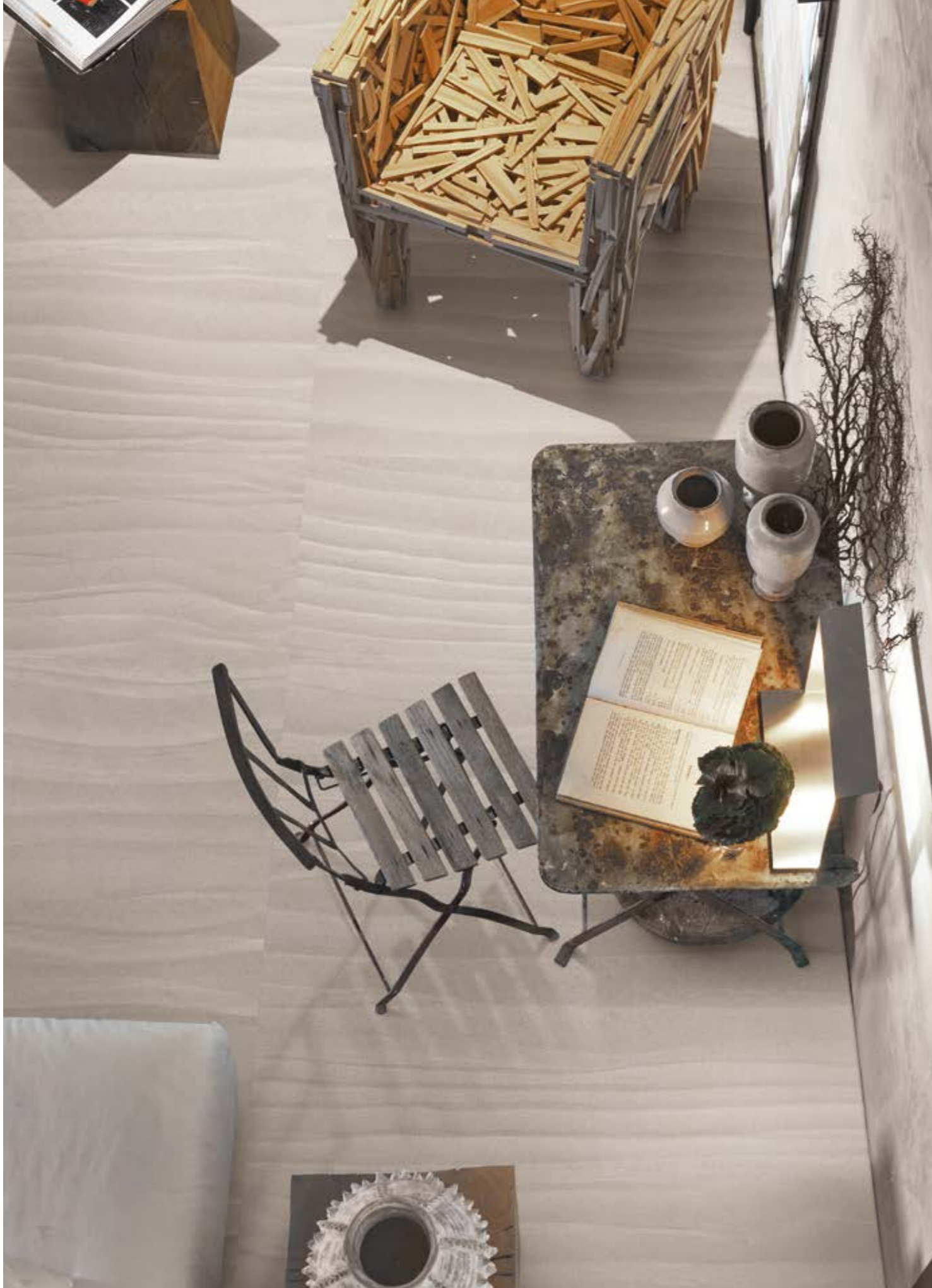
986Z8P 60x120 - 23 5/8 "x47 1/4 " Gobi Grey Lapp. Rett.

Sabbia NATA dalle MONTAGNE, FRAMMENTI di pietra erosi dal tempo che diventano EMOZIONI tattili.